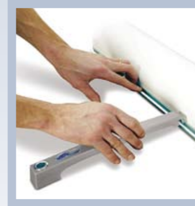
Genomtänkt design i minsta detalj. Haka fast stödfoten nedtill.