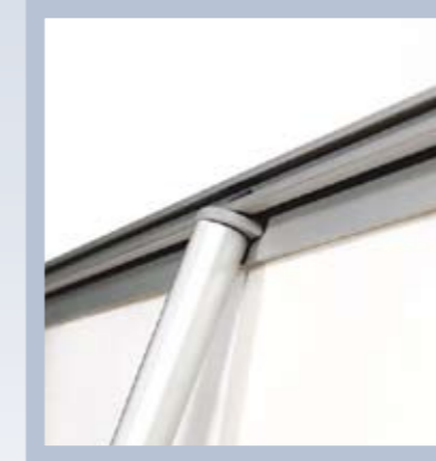
Fäst stödpinnen upptill och det är klart.